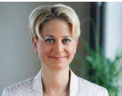
Sehr geehrte Eltern, Lehrerinnen und Lehrer,

seit einigen Jahren gelingt es uns, dass Kinder mit und ohne Beeinträchtigung miteinander lernen können. Dafür danke ich Ihnen und unterstütze Ihre Arbeit und Ihren Einsatz auch weiterhin.